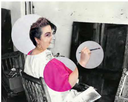
Marta C. Dehesa-k Amalia Avia interpretatu du interpreta a Amalia Avia